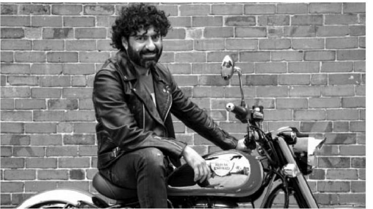
THROUGH THE GEARS Royal Enfield sales volume abroad

What is seen as a milestone for the UK team is the Royal Enfield Interceptor 650 emerging as the highestselling middleweight motorcycle in the UK since June 2019, a first by an Indian player. Based on the latest data available with the Coventry-based Motorcycle Industry Association, the Royal Enfield Meteor 350 also topped the pany insiders indicate that this was the result of a massive retail expansion.